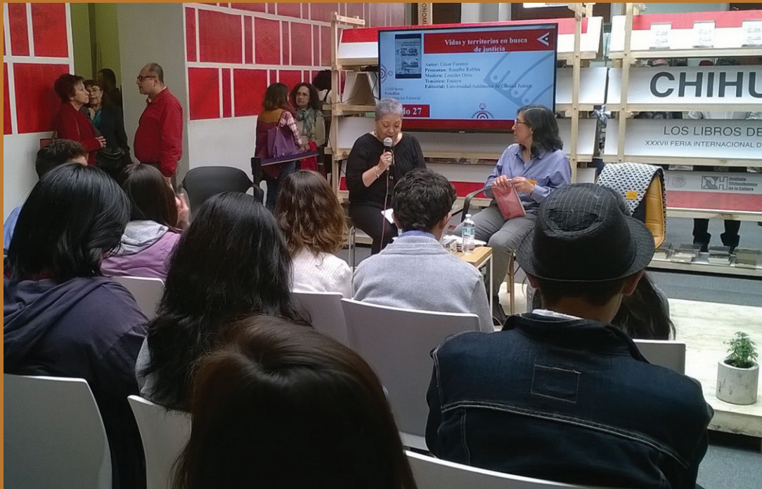
El estado de Chihuahua como invitado de honor en la FIL.

Con la presentación en el momento de 16 obras del sello editorial de la UACJ, paneles de discusión con escritores y críticos de esta localidad, la Universidad Autónoma de Ciudad Juárez participó en la Feria Internacional del Libro del Palacio de Minería, en la Ciudad de México, del 17 al 29 de febrero.