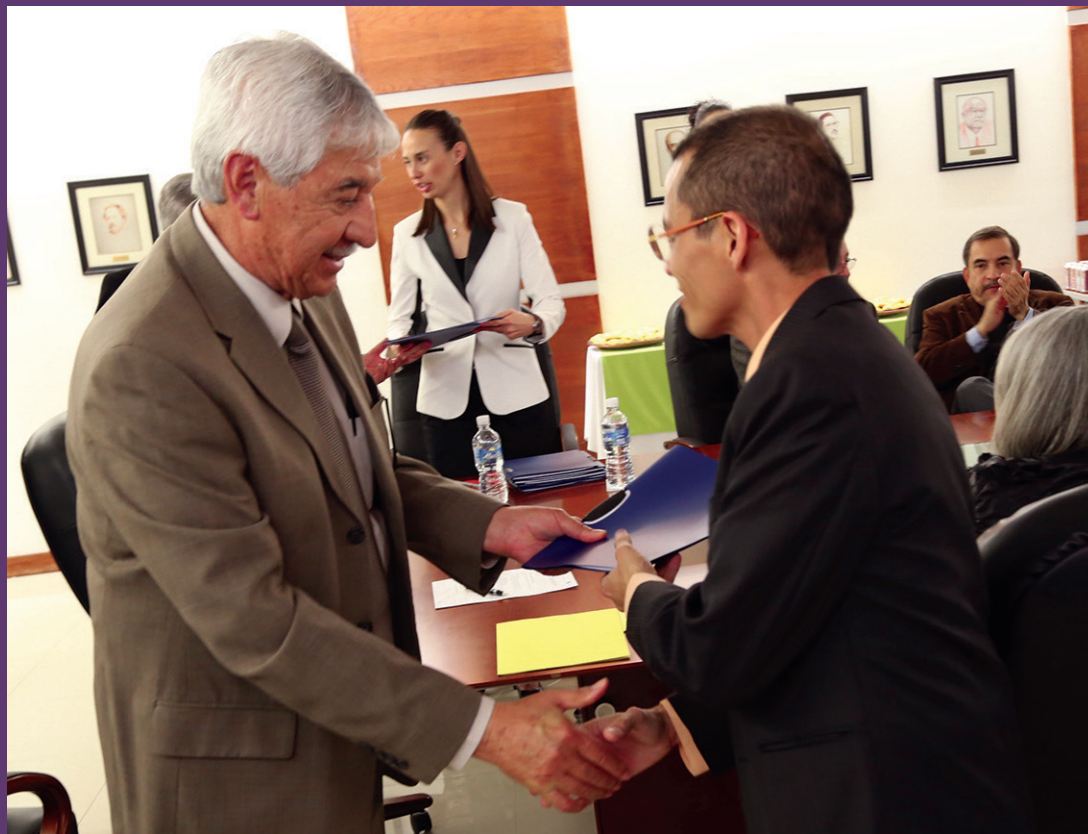
Docentes reconocidos en el modelo educativo de la UACJ.

La Universidad Autónoma de Ciudad Juárez hizo un reconocimiento a un grupo de 44 de sus docentes que cumplieron con el proceso de certificación en el modelo educativo de la institución.