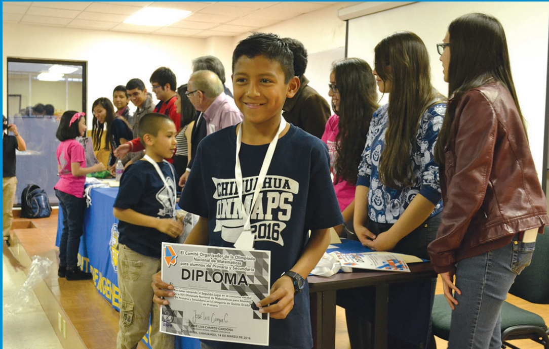
Entrega de diplomas a estudiantes destacados.

Estudiantes de nivel Primaria y Secundaria recibieron medallas por su destacada participación en la Olimpiada Nacional de Matemáticas cuyo objetivo es impulsar a los alumnos con aptitudes sobresalientes en el área de las matemáticas,