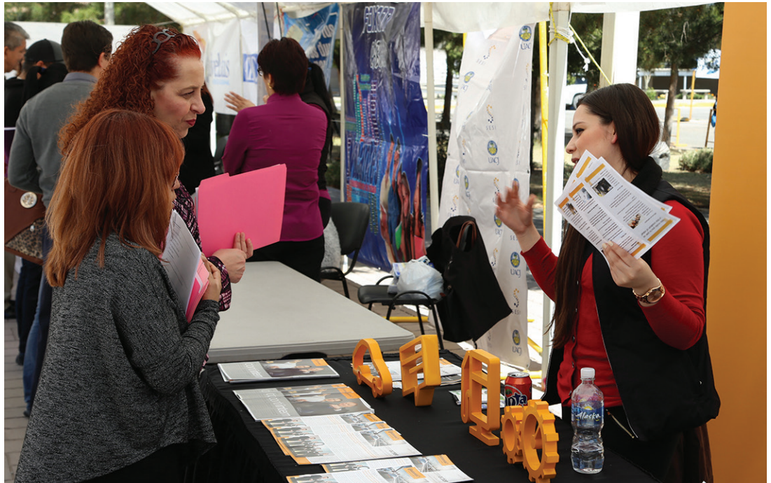
Asistentes a la FERIA del Empleo.

Entre las empresas que estuvieron ofertando puestos de trabajo estuvieron Grupo Cementos de Chihuahua, Datamark, Bosch, Smart, Genpact, Sura, Valeo, Foxconn, Seguros Monterrey, Xerox, Continental, Liverpool, Deloitte, PWC, Cinépolis y otras.