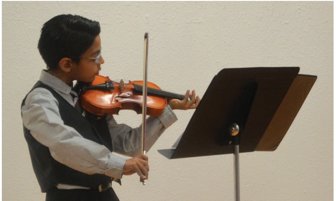
Con entusiasmo participaron en el recital los niños y jóvenes.

Cada uno de los maestros que se encuentra al frente de un grupo acordó con los alumnos las piezas que tocaron en el recital, de manera que el repertorio fue muy variado y se dejaron escuchar piezas desde Agustín Lara, hasta música de Star Wars, y también clásicos como Mahler, Bach y Verdi.