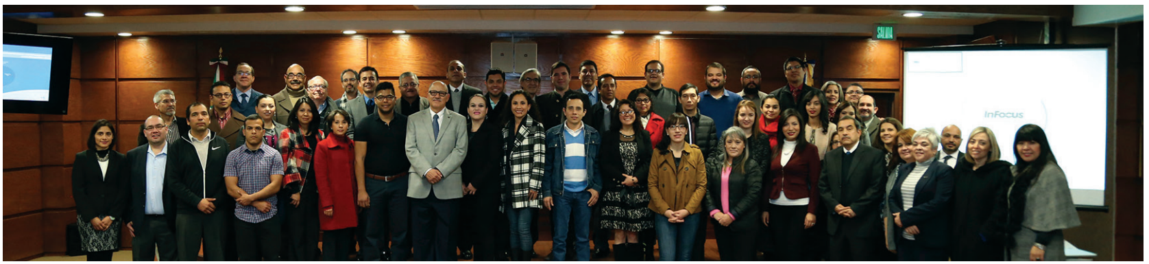
Nuevos profesores de tiempo completo.