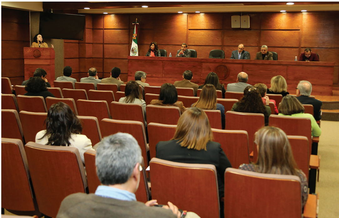
Asistentes a la reunión con titular local de educación.

Con el fin de conocer los análisis que en materia educativa tiene la UACJ, el 10 de febrero la Subsecretaria de Educación, Cultura y Deporte del gobierno del estado en Ciudad Juárez sostuvo una reunión con profesores investigadores