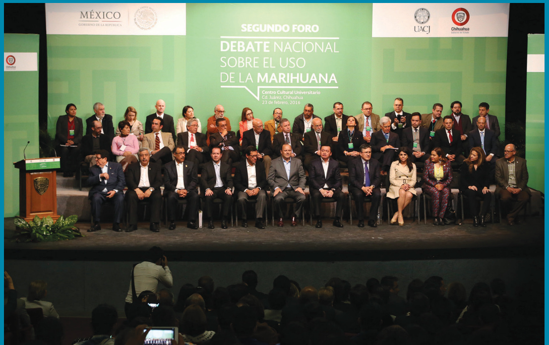
Autoridades que participaron en el foro.