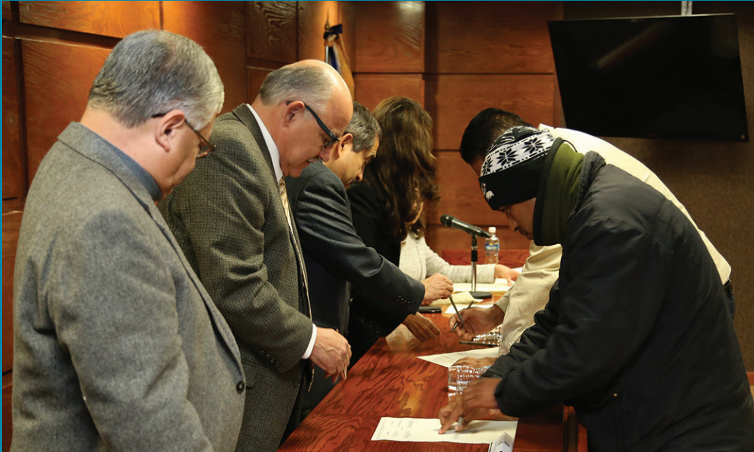
Nuevos miembros del STAUACJ.

Cincuenta trabajadores de la UACJ, entre personal administrativo y manual asignado a los diferentes institutos y la rectoría, ce-