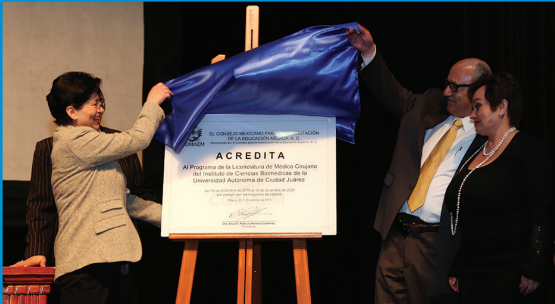
Develación de la placa de acreditación de Medicina.

El Consejo Mexicano para la Acreditación de la Educación Médica, A.C. (COMAEM), acreditó la calidad académica del Programa de Médico Cirujano, como se le conoce oficialmente a la licenciatura de medicina que imparte el Instituto de Ciencias Biomédicas (ICB) de la Universidad Autónoma de Ciudad Juárez.