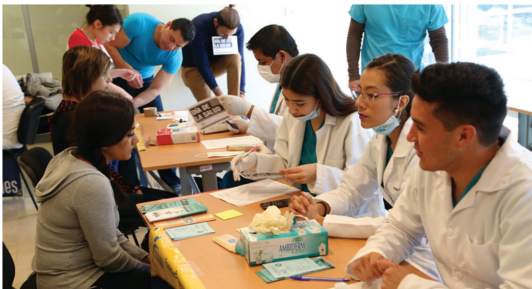
Los estudiantes que elaboraron el libro Sombras y Recuerdos del Centro Histórico.

En anticipación al Día Mundial de la Salud, celebrado el 7 de abril, la Universidad Autónoma de Ciudad Juárez puso a disposición de estudiantes una serie de revisiones médicas de hipertensión, salud bucal, visual, nutrición y acondicionamiento físico.