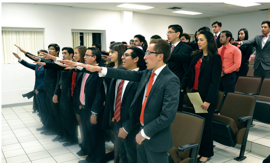
En la ceremonia de toma de protesta del IMEF.

Cuarenta y ocho estudiantes de la Universidad Autónoma de Ciudad Juárez rindieron protesta como integrantes del Capítulo Universitario del Instituto Mexicano de Ejecutivos de Finanzas (IMEF), en una ceremonia celebrada el 24 de febrero.