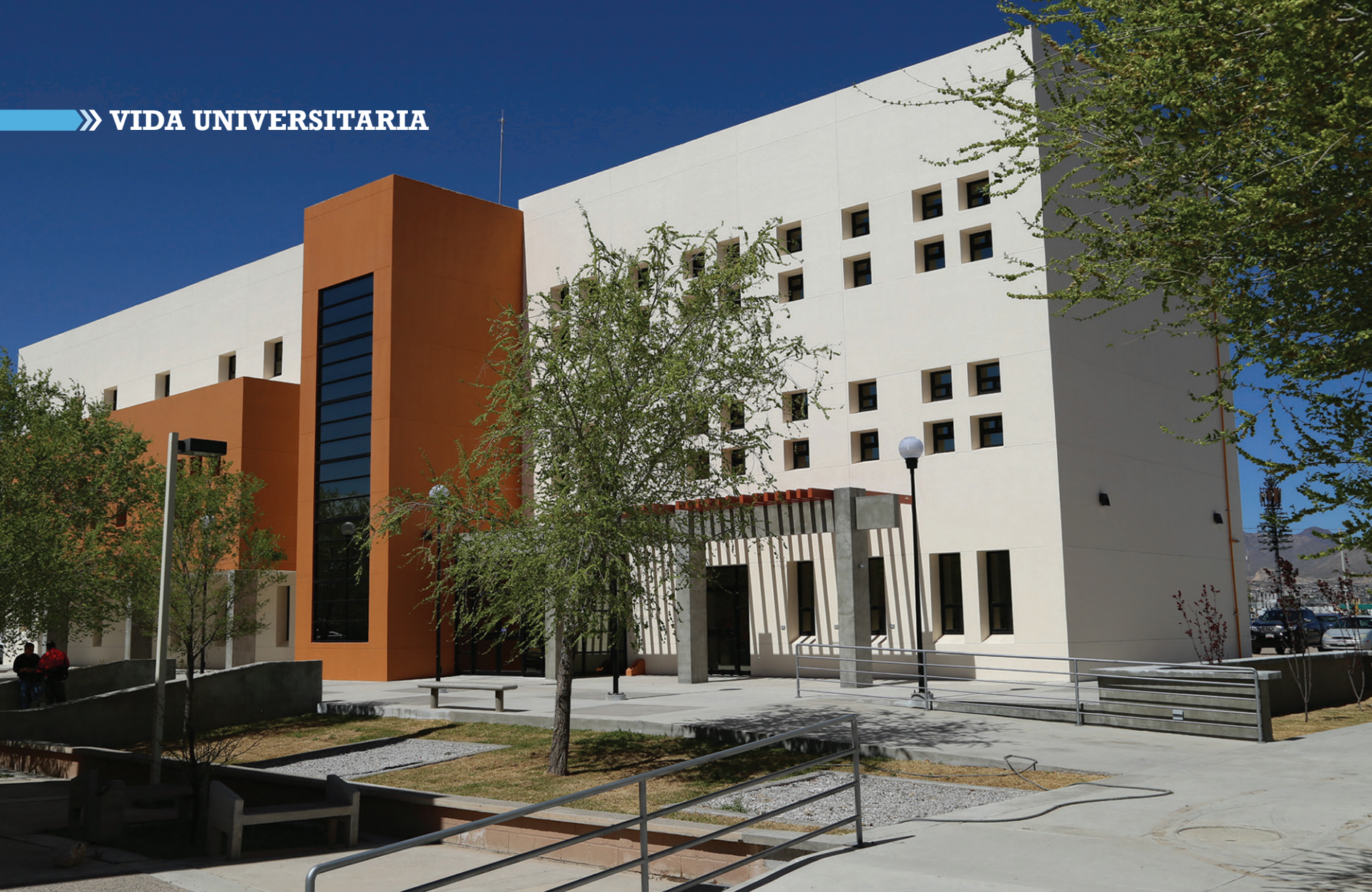
Edificio de posgrados.