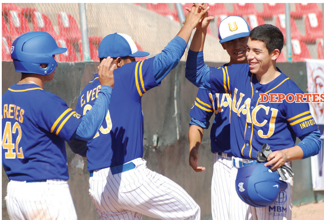
Deportistas de la UACJ.