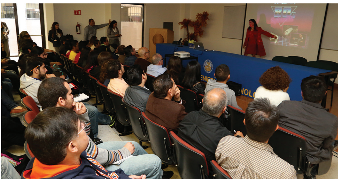
Plática sobre inventos de la NASA.

L a Universidad Autónoma de Ciudad Juárez (UACJ), fue sede de la conferencia informativa del concurso Space Race, organizado por la oficina de Transferencia Tecnológica de la Administración Nacional de la Aeronáutica y del Espacio (NASA).