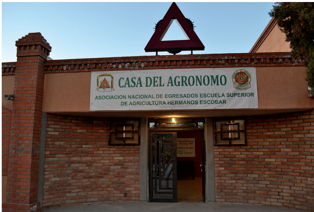
Instalaciones de la Asociación de egresados de ESAHE.