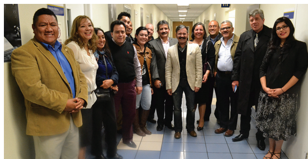
Participantes en la exposición "Más allá del retrato".

Los retratos que componen la exposición fueron propuestas de cada uno de los integrantes del curso,